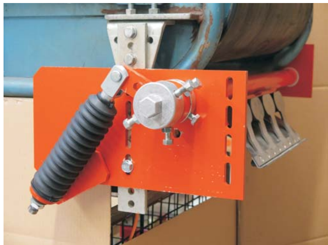
Abgeklappte Stellung mit Sicht auf die Rückseite der Abstreifelemente