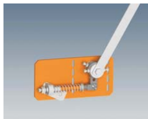
Lage des Spannschlüssels in Arbeitsposition